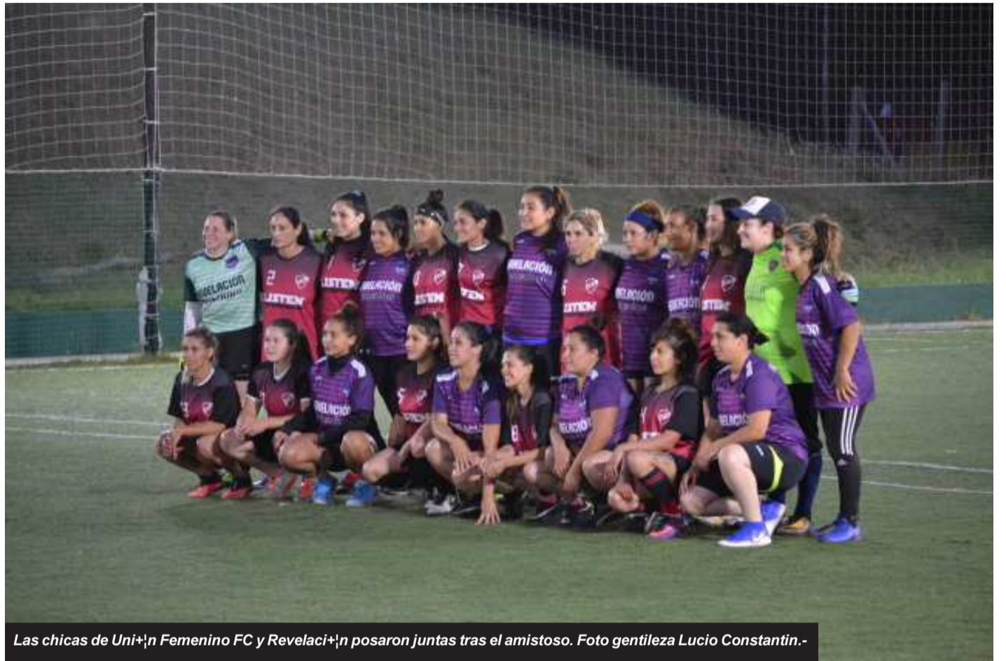
Las chicas de Unión Femenino FC y Revelación posaron juntas tras el amistoso.

El encuentro se puso lindo, finalizó con un 6 a 3 en favor de Unión y aunque el resultado sea anecdótico, les sirve a ambos elencos para sacar conclusiones y seguir avanzando.