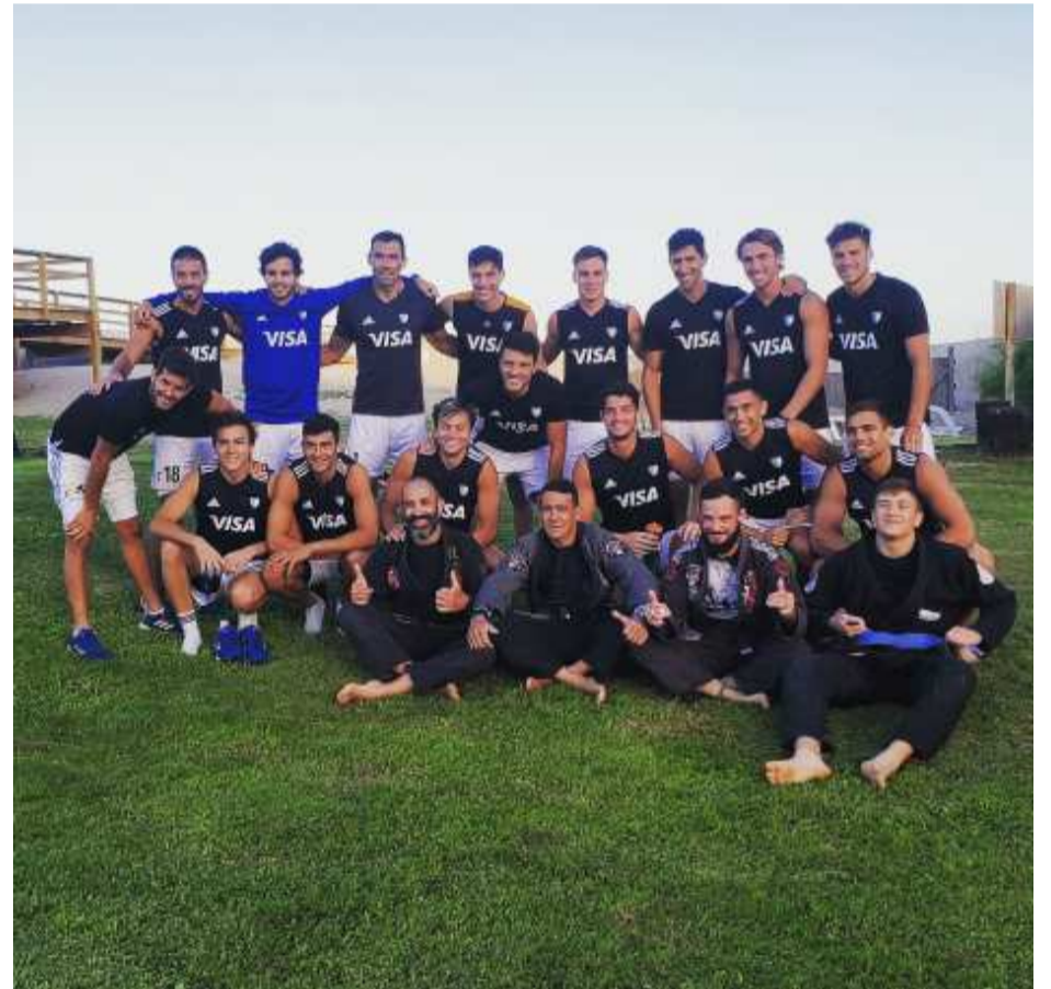
Los Leones y los Nova Uniao Villa Gesell tras una gran jornada de Jiu-jitsu.-

Sobre la oportunidad, Chamas se mostró agradecido con Carlos «El Chapa» Retegui, entrenador del seleccionado argentino del hockey sobre césped. «Lo conozco al Chapa de chico. Él jugaba al hockey en Sanfer y yo al rugby. Además su primo es mi mejor amigo. Íbamos a ir anteriormente con Las Leonas, pero la burbuja era más cerrada y no se pudo. Finalmente lo pudimos concretar con la selección masculina y no descartamos hacerlo con las chicas en unos días».