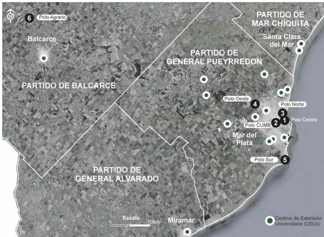
Localización de los Centros de Extensión Universitaria de la UNMdP.