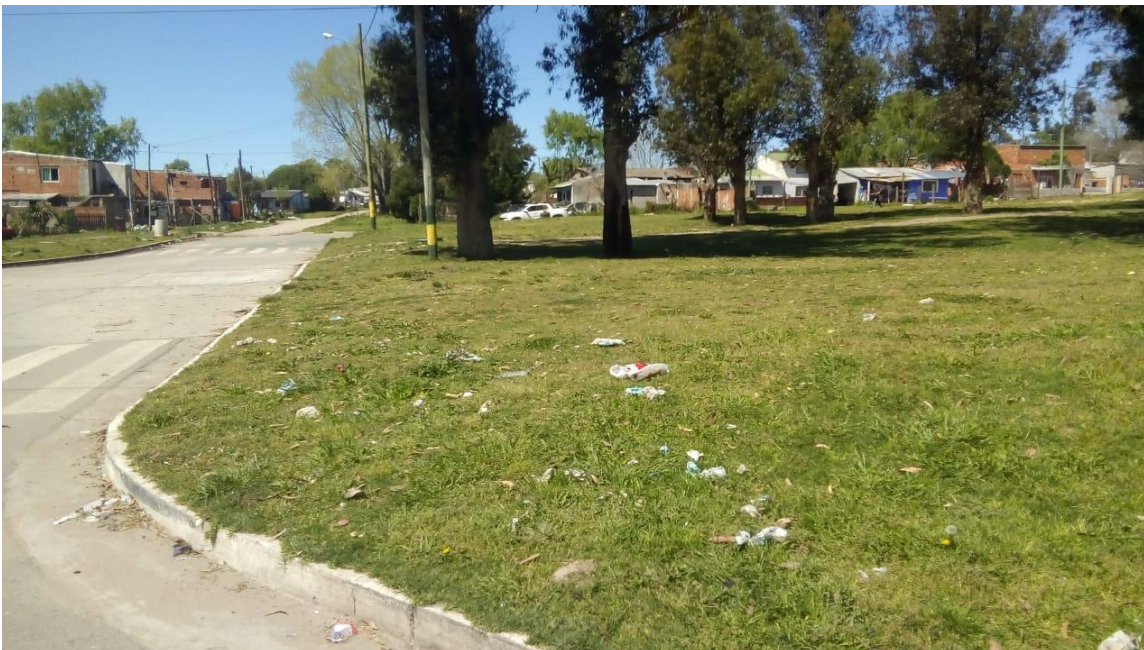
Esquina Cerrito y 65