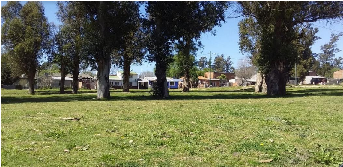
Sector arbolado de la plaza donde se propone el recorrido de un sendero interno.