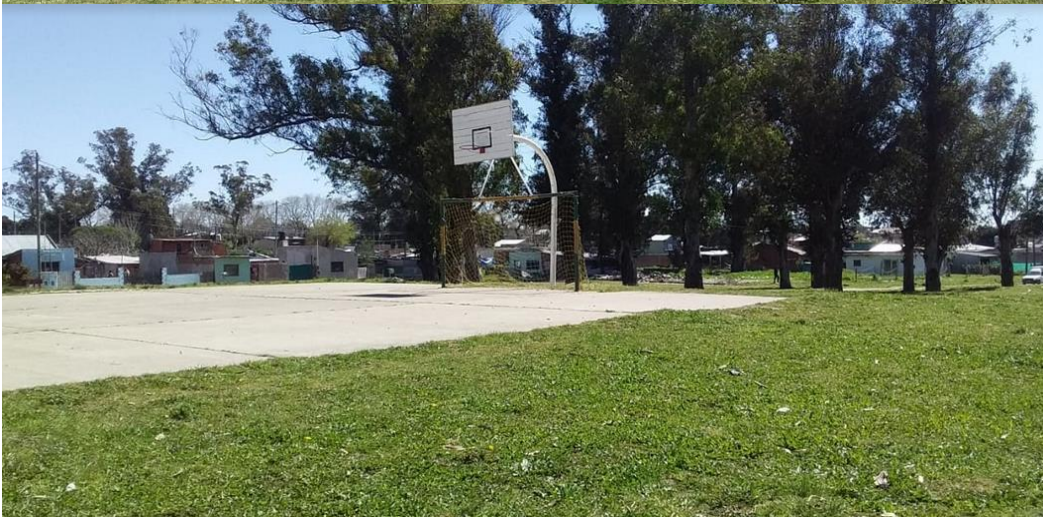
Playón de uso deportivo y eventos barriales / sociales.