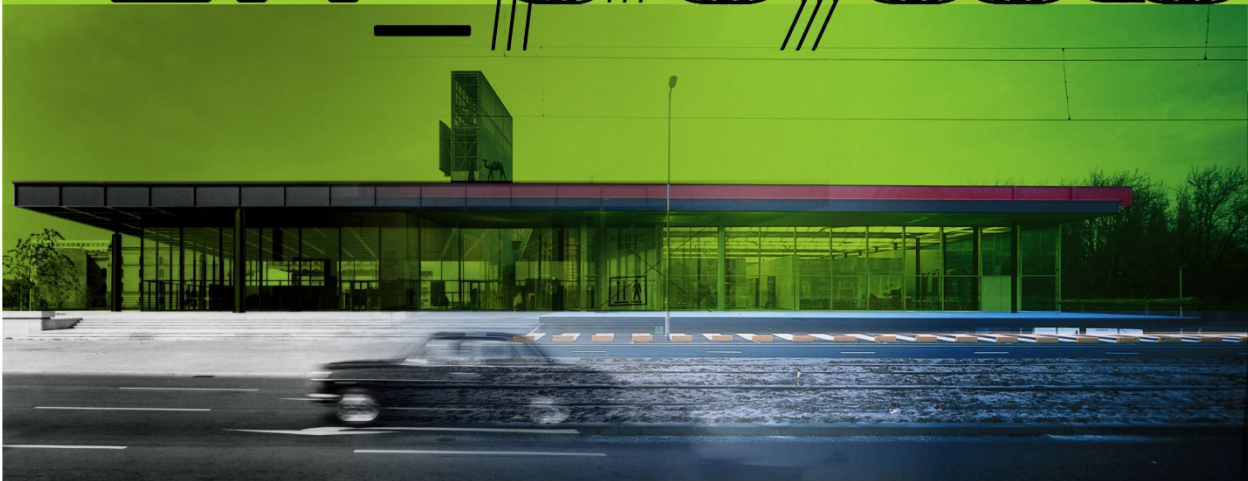
Neue National Gallerie. Mies van der Rohe. Berlin 1968